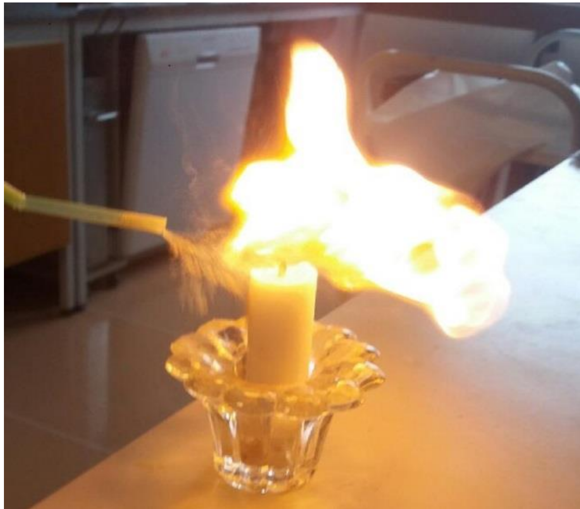
Brinnande nikt (KRC)