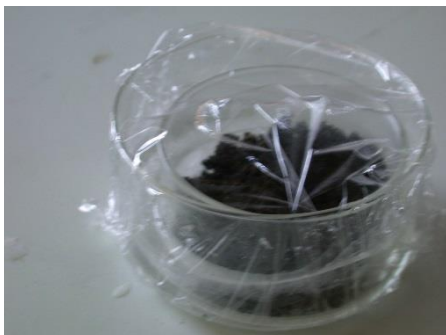
Figur 1: Försöksuppsättning med plastfolie

Vi andas syre och andas ut koldioxid. Vad gör bakterier?