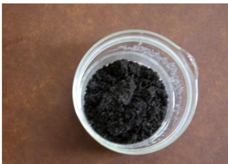
Figur 2: Vit kalciumkarbonat har fällts ut

Resultat: Kalkvattnet grumlas eftersom de flesta bakterierna bildar koldioxid. Koldioxid bildar fällning med kalkvattnet.