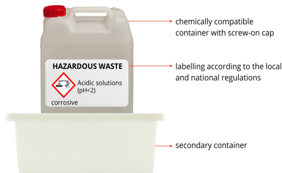
An example of storage container for liquid waste